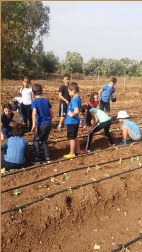
תלמידים בפעילות בחווה

התכנון המקיים של החוות יביא למודעות סביבתית גבוהה בקרב צוות החווה ותלמידי החקלאות. המחקר מציע מודל למבנה הפיזי של חווה חקלאית לימודית הייחודית לישראל. המודל המוצע שונה למדי מהחוות הקיימות כיום, בשני תחומים: 1. החווה